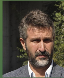
Alberto Varela Paz Alcalde-Presidente de Vilagarcía de Arousa.

Este concello leva anos traballando para modernizar a administración e, igualmente, para procurar unha fiscalidade que resulte o menos gravosa posible, máis xusta e equitativa, incrementando as bonificacións e xestionando diante doutras administracións ingresos que permitan reducir o custe que para todos nós significan os servizos que a diario recibimos. Este Plan Personalizado de Pagos que hoxe presentamos é unha mostra de canto vimos dicindo: grazas á mellora dos sistemas de xestión, financiada con cargo aos Fondos FEDER da Unión Europa, dende agora será posible que poidas pagar os teus principais tributos nos prazos que mellor te conveñan. Todos queremos máis e mellores servizos pero logralo só depende de nós mesmos. Grazas, en todo caso, por contribuír, xa sexa dunha soa vez ou en 4, 6 ou 11 meses: así demostrarás o teu compromiso coa túa cidade e farás posible incrementar o investimento social e as axudas aos sectores máis afectados pola crise.